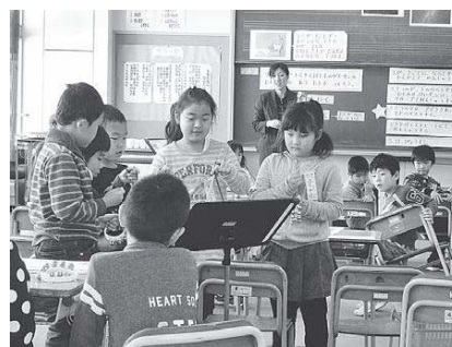
【星空をイメージした音づくり】