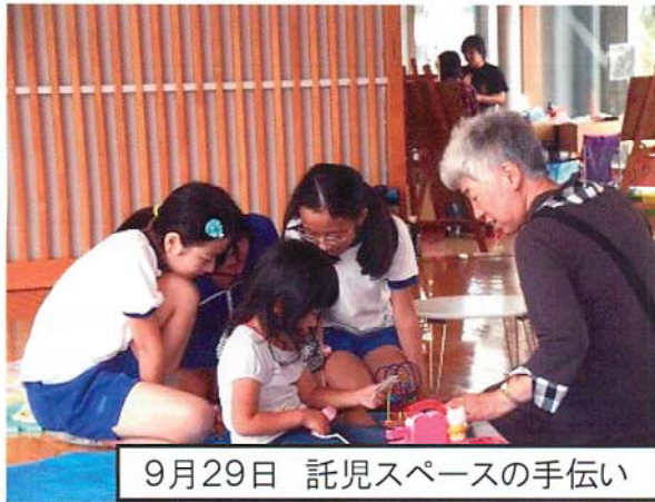
9月29日 託児スペースの手伝い