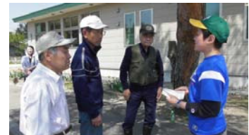
地域の方への説明