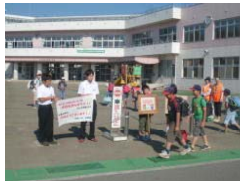
城西小前での合同あいさつ運動