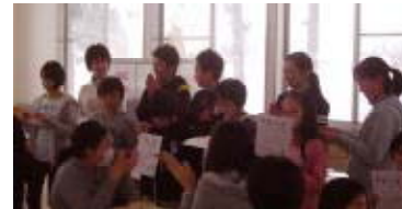
1.25 給食の時間後 各学年のなわとび優秀者の表彰