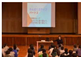
12.1 全校朝会 なわとび運動の提示