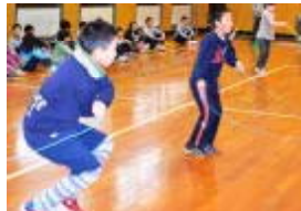
1.19 児童集会 練習の成果を披露