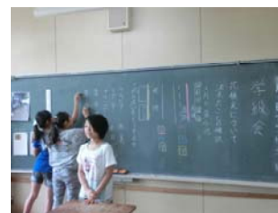
計画反省は子どもたちで

年4回の「チャレンジ活動」を通して何度も失敗を重ねて経験するうちに、本気で取り組む児童の姿勢が随所に見られるようになった。