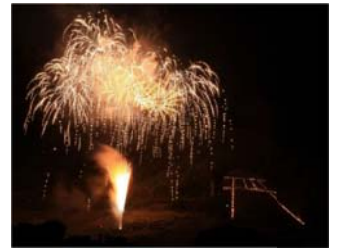
【ぶどうまつりでの鳥居焼き】

国宝「大善 だいぜんじ 寺本堂」や重要伝統的建造物群保存地区等と、武田信玄の菩提寺・恵林寺のしんげんさんや甲州街道勝沼宿におけるぶどうまつり等からなる歴史的風致の維持向上を図るため、伝統的建造物群保存地区環境整備や農業基盤整備促進、歴史文化の発信事業等が位置づけられています。