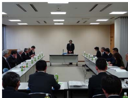
大館市都市計画審議会