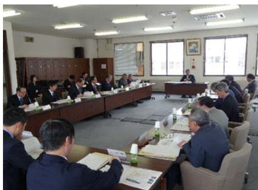
大館市歴史的風致維持向上協議会

作成された計画案は、関係者協議や地区座談会による意見交換を重ね、また市民へのパブリックコメントを実施し、大館市文化財保護審議会や大館市都市計画審議会への報告、大館市歴史的風致維持向上協議会(歴史まちづくり法第 11 条の法定協議会)における検討を踏まえ、「大館市歴史的風致維持向上計画」として決定した。