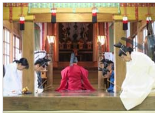
扇田神明社例祭の神事

扇田神明社には、住民が誇りとする佐竹宗家ゆかりの御神輿があり、毎年7月の例祭では扇田地区を古式に則って渡御される。 また、火伏祭りのジャジャシコは、各家々を祓い清めて回る、春一番の風物詩である。 扇田の人々は古くからの例祭や行事を、伝統としきたりを守って現代に受け継いでいる。