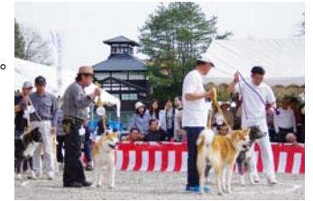
秋田犬本部展示会

秋田犬は大館の先人たちが結成した秋田犬保存会の尽力により、日本で初めて天然記念物に指定された。保存会は展示会を開催するなど現在まで、その血脈を守り続けている。 大館駅前には、大館生まれの秋田犬である忠犬ハチ公の像があり、毎年慰霊祭や生誕祭が行われている。 市内各地に秋田犬の像やデザインがあり、秋田犬を愛する市民の深い愛情が受け継がれている。