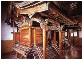
重要文化財(大館八幡神社)

大館八幡神社や桜櫓館、大館神明社などの歴史的な建造物を保存補修し、後世に継承する。