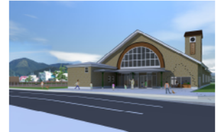
ハチ公の駅(仮称)整備イメージ図

天然記念物秋田犬の歴史や文化の情報を発信し、地域の歴史的資源を巡るまち歩きを推進を図る。