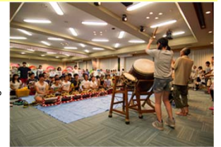
大館囃子の合同練習会

民俗文化財や郷土芸能の調査や記録保存を行い、活動を継続するための支援につなげる。