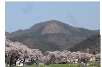
市街地からみる鳳凰山

鳳凰山の麓に造られた岩神貯水池は、長い間農業や市民の生活を支えてきた。その上流部には古くから雨乞いの場所として信仰を集めてきた沼窪神社があり例祭が続けられている。 貯水池の周辺にはたくさんの桜が植樹され、四季折々の姿を見せる鳳凰山大文字とともに、ふるさとの風景として多くの市民に愛されている。