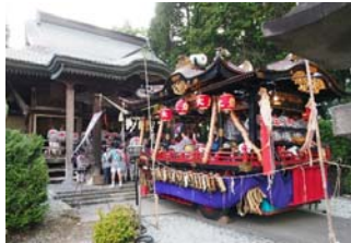
大館神明社に参拝する山車

江戸時代の初めに大館佐竹氏により作られた城下町大館には、町割り当時の地名が今に残る。大館神明社の秋の例祭ではその町内を御神輿が巡り、山車が街を奏でながら練り歩く。 また城下が開かれた「市」が起源と伝えられる大館アメッコ市が冬の風物詩として現代に受け継がれている。