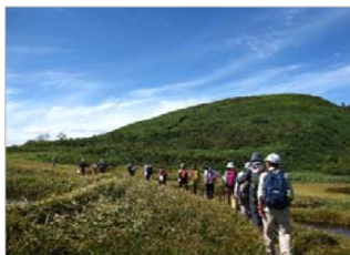
半夏生の参拝登山

田代岳は、山そのものが御神体で、毎年7月2日頃の半夏生に、9合目湿原の池塘で行う作占いの神事が続けられている。 山頂の田代山神社の例祭を訪れる参拝者は、豊作と家内安全を願い、笹やツゲを持ち帰り、田の水口に立てて虫除けとする習わしが今も続いている。