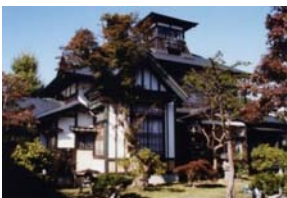
登録有形文化財(桜櫓館)