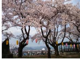
桜が満開の桂城公園

大館城本丸跡の桂城公園を、新庁舎建設事業と連携して、城址公園にふさわしい景観の形成と、にぎわいの創出をめざす。