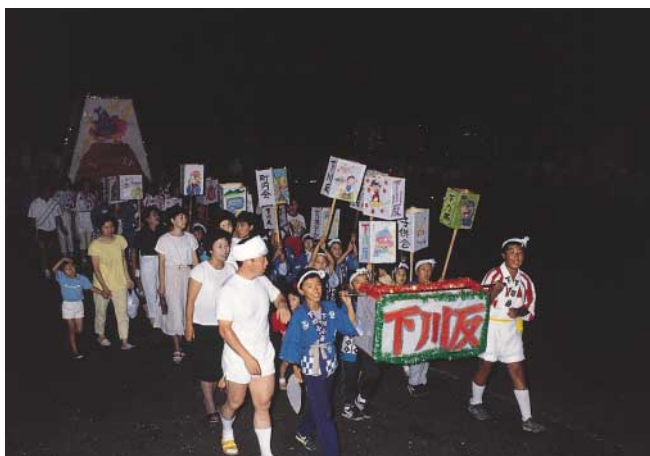
「山コチンチコ」(比内町扇田)