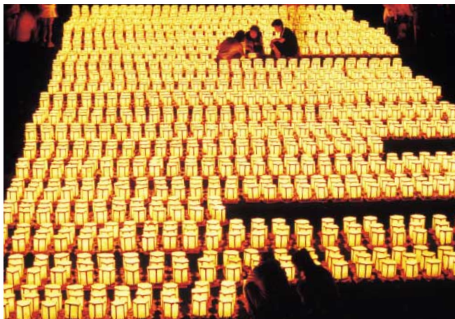
「燈籠」(大館市長木川)