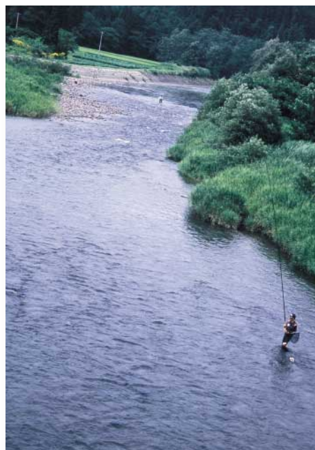
「全国鮎釣り大会」(田代町早口川)