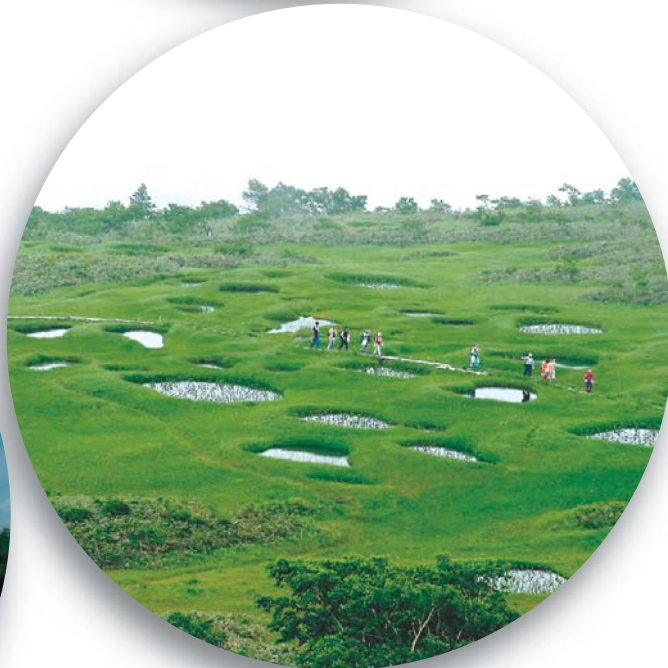
田代町:田代岳9合目湿原