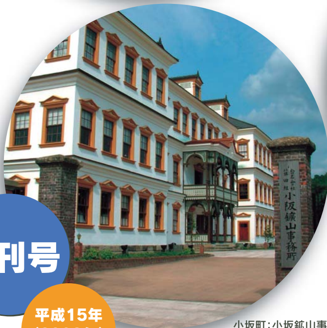
小坂町:小坂鎮山事務所