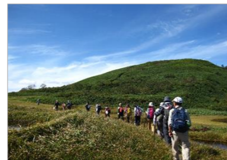
半夏生の参拝登山

山頂の田代山神社の例祭を訪れる参拝者は、豊作と家内安全を願い、笹やツゲを持ち帰り、田の水口に立てて虫除けとする習わしが今も続いている。