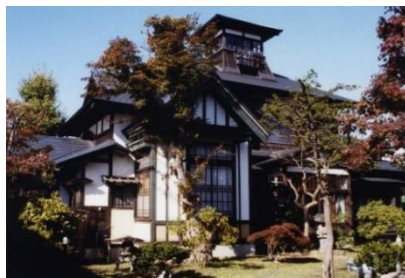
桜櫓館(登録有形文化財)