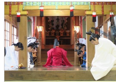
扇田神明社例祭の神事

扇田の人々は古くからの例祭や行事を、伝統としきたりを守って現代に受け継いでいる。