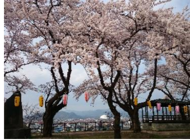
桜が満開の桂城公園

大館城本丸跡の桂城公園を、新庁舎建設事業と連携して、城址公園にふさわしい景観の形成と、にぎわいの創出をめざす。