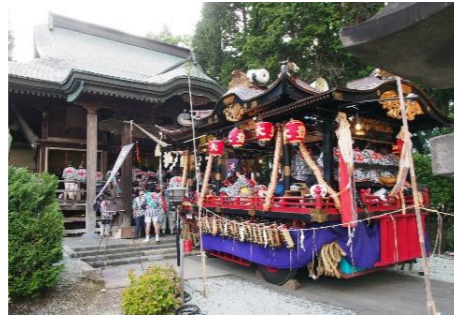
大館神明社に参拝する山車

また城下が開かれた「市」が起源と伝えられる大館アメッコ市が冬の風物詩として現代に受け継がれている。