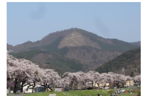
市街地からみる鳳凰山

貯水池の周辺にはたくさんの桜が植樹され、四季折々の姿を見せる鳳凰山大文字とともに、ふるさとの風景として多くの市民に愛されている。