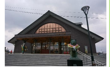
観光交流施設「秋田犬の里」完成写真

天然記念物秋田犬の歴史や文化の情報を発信し、地域の歴史的な資源を巡るまち歩きを推進を図る。