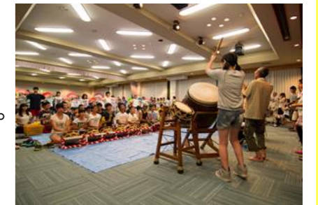
大館囃子の合同練習会

民俗文化財や郷土芸能の調査や記録保存を行い、活動を継続するための支援につなげる。