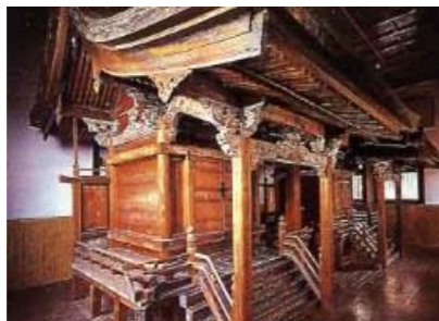
大館八幡神社(重要文化財)

大館八幡神社や桜櫓館、大館神明社などの歴史的な建造物を保存補修し、後世に継承する。