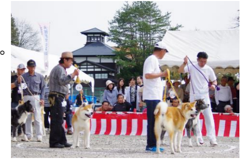
秋田犬本部展覧会

市内各地に秋田犬の像やデザインがあり、秋田犬を愛する市民の深い愛情が受け継がれている。