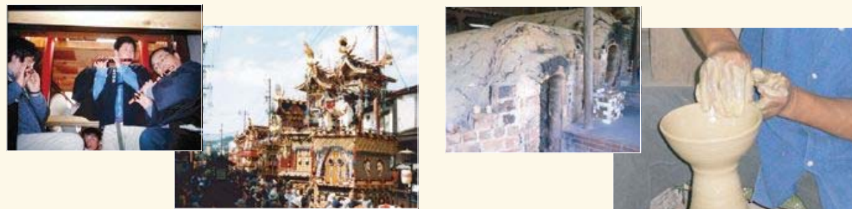
重要無形民俗文化財の例(祭礼:高山祭)

歴史的風致の構成要素である「地域におけるその固有の歴史及び伝統を反映した人々の活動」とは、伝統的な工芸技術による生産や工芸品の販売、祭りや年中行事等の風俗慣習、地域において伝承されてきた民俗芸能に加え、鍛冶や大工、郷土人形製作等の民俗技術等も含まれます。また、伝統的な特産物を主材料とする料理や、地域の伝統的な技術や技能による物品の展示なども「歴史及び伝統を反映した人々の活動」と捉えることができます。