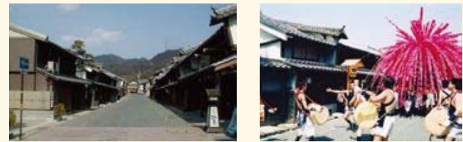
地元で「うだつの上がる町並み」と呼ばれている重要伝統的建造物群保存地区において、江戸時代に起源を持つ市指定無形民俗文化財である「美濃まつり」等の行事が継続的に実施され、良好な市街地の環境を形成している。(岐阜県美濃市)

そのため、単に歴史上価値の高い建造物が存在するだけではなく、地域の歴史と伝統を反映した人々の活動が展開されていて初めて歴史的風致が形成されるものとし、この歴史的風致をそのまま「維持」するのみならず、歴史的な建造物の復原や歴史的風致を損ねている建造物の修景等の手法によって、積極的にその良好な市街地の環境を「向上」させることを目的としています。