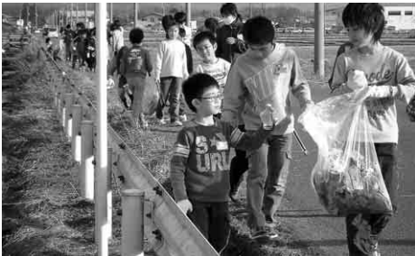
【通学路のクリーンアップ】

中学生が小学校に行き、家で集めたペットボトルキャップを持って登校してきた小学生と笑顔であいさつを交わしています。