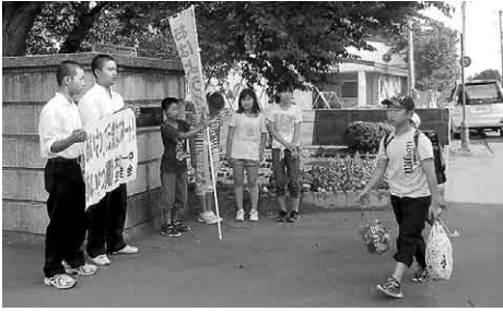
【朝のあいさつ運動】

中学生が小学校に行き、家で集めたペットボトルキャップを持って登校してきた小学生と笑顔であいさつを交わしています。