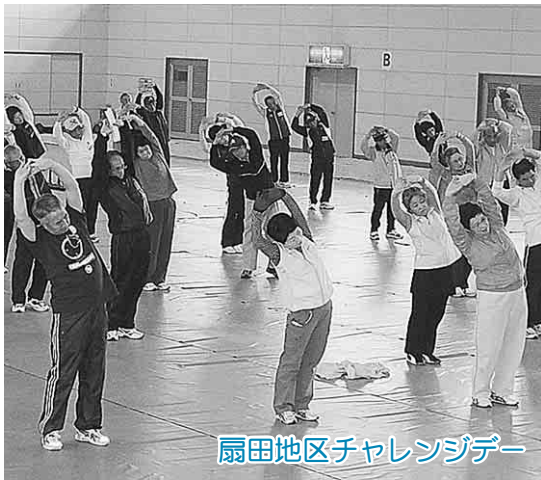
扇田地区チャレンジデー

受診の際には、事前に「平成24年度保健ガイド」をご覧ください。受診時の注意事項や検診が無料になる場合、検診予定日などをご確認ください。 (紛失したかたには、健康推進課が総務課で差し上げます)