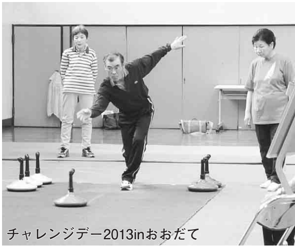
チャレンジデー2013inおおだて