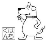
「はちくん」は大館市健康づくり応援マスコットです。