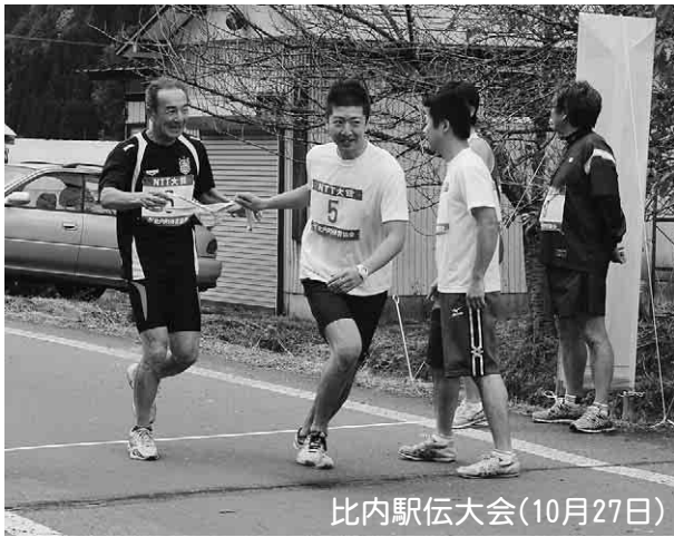
比内駅伝大会(10月27日)