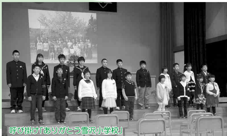
呼び掛け「ありがとう雪沢小学校」

閉校式は同校の体育館で行われ、教職員や卒業生など約230人が見守るなか、ステージのスクリーンに映し出された思い出深い学校行事や雪沢の豊かな自然をバックに全児童21人が「ありがとう雪沢小学校」と呼び掛け、未来に向けての誓いを新たにしました。