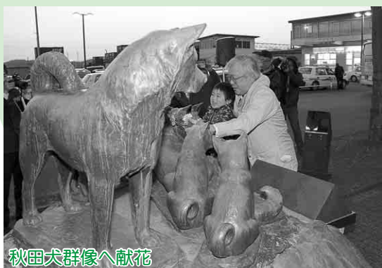
秋田犬群像へ献花