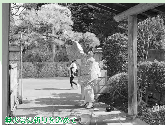
無火災の祈りを込めて

扇田地区で伝統のジャジャシシ祭りが行われ、春の訪れを告げるほら貝と錫杖の音が町内に響き渡っていました。この祭りは今から約160年前に、扇田地区が何度も火災に見舞われた際に無火災を祈願したのが始まりとされ、当時の火消したちが持つ錫杖の金の輪が、ジャラジャラと鳴る音が、祭りの名前の由来とも言われています。 今年も宮司が、家々で用意した水を軒先に掛けて無火災を祈りました。