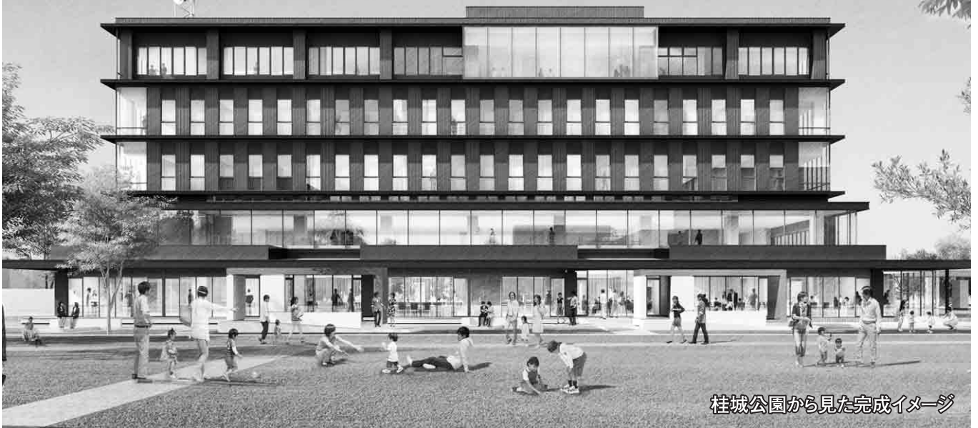
桂城公園から見た完成イメージ

市では、「市民に親しまれ、安心して暮らせる街の拠点となる庁舎」を目指して本庁舎建設事業を進めており、平成31年3月18日に地元施工業者と工事契約を結び、建設工事に着手しました。