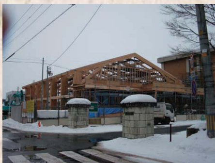
・ 柱・梁・方杖 状況