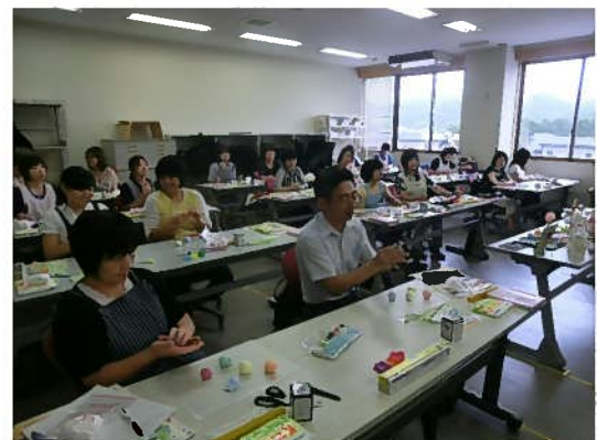
「造形～年度を教材とした指導の基本、活用のためのアイデア」 (講師：クラフトリオ)