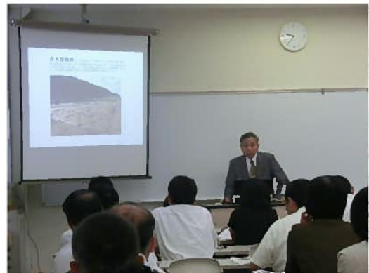
「大館散策～ふるさと大館名所手帳」 (講師：大館市文化財保護協会 清野事務局長)