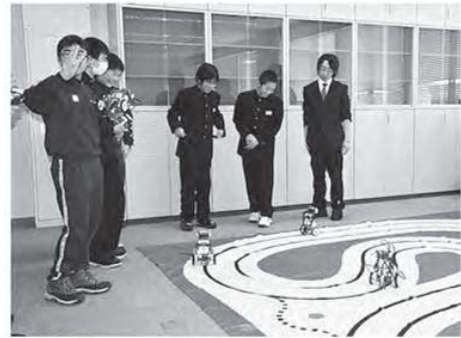
図3 コースを走らせる中学生

が展開する子どもハローワークの一環として、プログラマー（体験を実施しました。小学生はショックタンカップ、中学生はライトレースするプログラムを制作しました。みんな熱中（図3）して、中々終われませんでした。アンケートの結果は、「楽しかったですか」に対してとても楽しかったが89%、まあまあ楽しかったが11%、「将来役に立つと思いますか」に対してとても役に立つが78%、少し役に立つが17%でした。