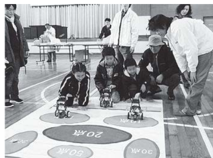
図2 ショクタンカップに挑戦する小学生