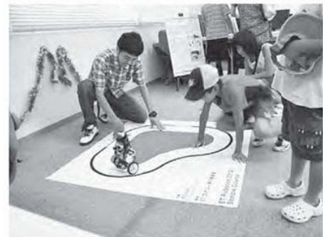
図4 デモ走行を見学する小学生

③ 杉風祭、産業教育展～毎年9月の杉風祭（本校学園祭）や10月の産業教育展において、来場者にロボットの展示とデモ走行を行っています。子どもたちはロボットの走る姿を興味津々に見入っていました。（図4）