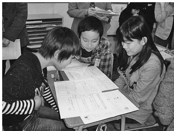
【3人グループでの改善行動へのアドバイス】