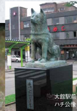
大館駅前ハチ公像