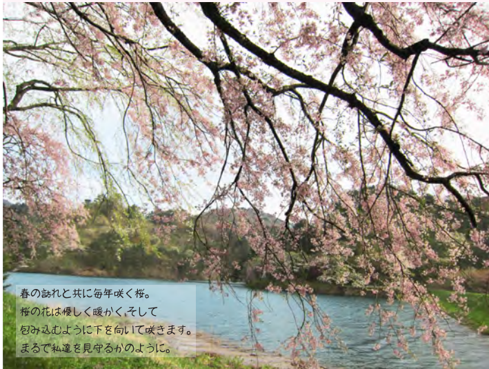
春の訪れと共に毎年咲く桜。 桜の花は優しく暖かく、そして 包み込むように下を向いて咲きます。 まるで私達を見守るかのように。