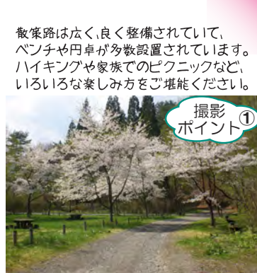
散策路は広く、良く整備されていて、 ベンチや円卓が多数設置されています。 ハイキングや家族でのピクニックなど、 いろいろな楽しみ方をご堪能ください。