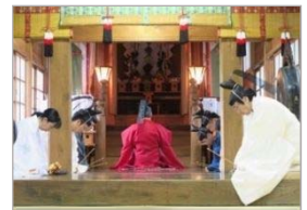
扇田神明社例祭の神事

扇田地区の東にある扇田神明社には、江戸時代に佐竹宗家より拝領した御神輿があり、それが今も大切に保存されていて、扇田地区の人々により受け継がれ、戊辰戦争の後に建てられた寺社、商家などとともに良好な歴史的風致を形成しています。