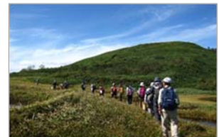
半夏生の参拝登山

田代岳は山そのものが御神体で、豊作を祈る大事な文化として農民たちに共有されてきたことが、この地方特有の風土を育み、今では農業者に限らず、五穀豊穡や生活安寧を願う人々に、田代岳の作占が受け継がれ、田代岳周辺に良好な歴史的風致が形成されています。