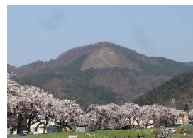
市街地からみる鳳凰山

鳳凰山(標高520.6m)は、市中心部の東側に位置し、市民の暮らしが息づく大館盆地を見守っています。麓には岩神ふれあいの森、岩神貯水池、岩神沢の上流部にあたる鳳凰山と秋葉山の鞍部には沼窪神社があり、鳳凰山を背景に様々な伝統行事や市民の活動が続いています。鳳凰山周辺一帯は、自然散策や登山など大勢の人々が訪れ、自然と一体となって良好な歴史的風致を形成しています。