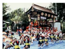
大日神社に奉納される独鈷囃子

独鈷囃子や浅利氏ゆかりの歴史的資産を守り続けてきた独鈷囃子保存会や独青团の活動は、良好な歴史的風致を形成しています。