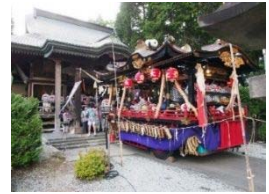
大館神明社に参拝する山車

大館城周辺に開かれた市を源流に大館の町が形成され、今も秋の大館神明社例祭と、冬の大館アメッコ市がふるさとの祭りとして多くの市民の手で受け継がれ、大館城下の市街地に良好な歴史的風致を形成しています。