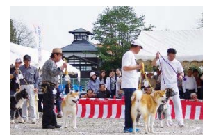
秋田犬本部展覧会

現在では、大館アメッコ市、きりたんぼまつりなど大館を代表するイベントやお祭りに欠かせない存在で、市内のいたるところにみられる秋田犬の像やデザインは、秋田犬に対する大館市民の愛情が表れたものであり、これらが一体となって良好な歴史的風致を形成しています。