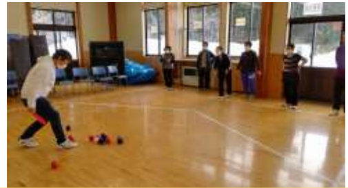
大接戦を繰り広げている「上新町隣組」と「ユニカール同好会」