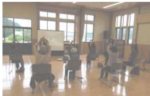
フレイル予防ビデオ講座の様子

講座内容は事前にお知らせいたしますので、皆様誘いあわせのうえ多数の参加をお待ちしております。