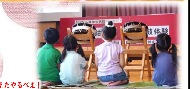
段ボールとパチはあります。またやるべ!