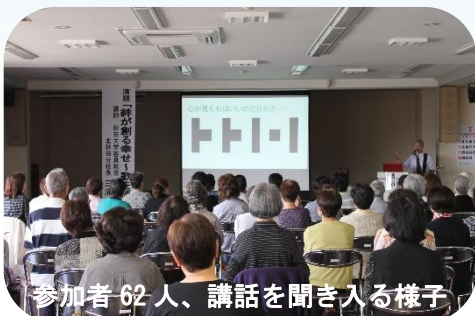
参加者 62 人、講話を聞き入る様子