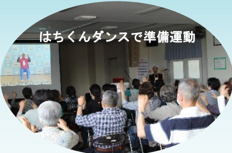
はちくんダンスで準備運動