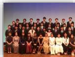
《扇田・西館・東館小出身者》

8月15日、ほくしか鹿鳴ホールにて対象者中348人が参加して「20歳を祝う会」が開催されました。比内地域出身の参加者もお世話になった方々や家族への感謝、社会の一員として決意を新たにしていました。