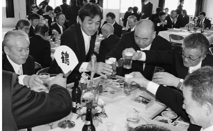
学生の頃の思い出話で盛り上がりました