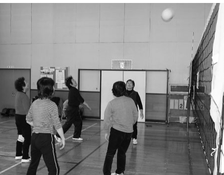
練習では女性チームがリードしていました。

「あつてグッド」は、歩いて行くの方言「あつてえぐ」と会って良かった(グッド)を掛け合わせ、もじったものです。