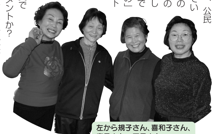
左から規子さん、喜和子さん、慶子さん、正子さん