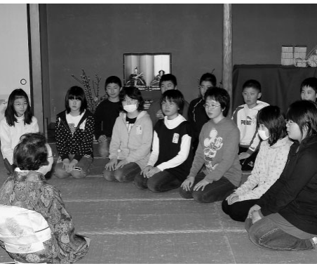
さすが6年生、落ち着いてお話を伺いました