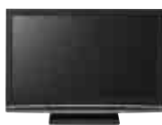
デジタル放送対応 液晶テレビ