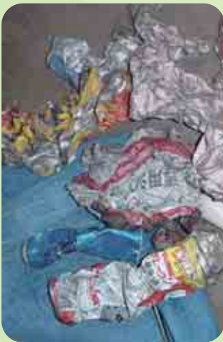
破砕機の内部から 見つかった缶類

5月5日(水)10時15分と6月16日(水)13時59分、沼館字下堤沢の粗 大ごみ処理場で、破砕処理中の爆発事故が発生しました。 この事故で、処理施設の一部が破損する被害が出ています。もう一 度、皆さんで「正しいごみの出し方」を確認しましょう。