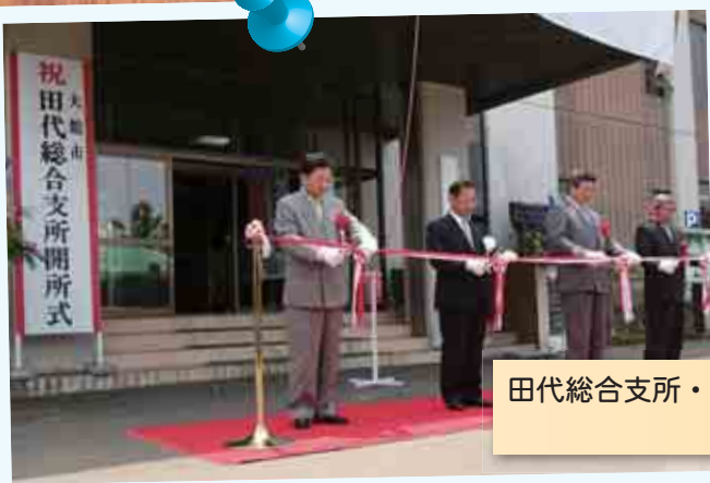
田代総合支所・比内総合支所開所式 (平成17年6月20日)