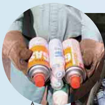
未使用のカセットボンベや制汗スプレーも