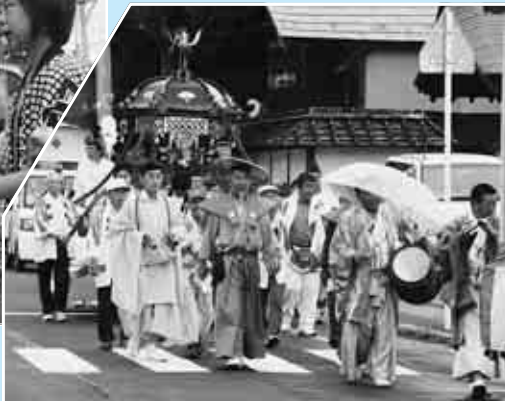
▲ 威勢の良い掛け声が響きました

扇田神明社の例大祭が行われ、みこしやはやし山車がにぎやかに練り出しました。神事が行われた後、神社のみこしが出発。巫女を乗せた神宝車、稚児車、おみこし、神馬と続く行列が、扇田の各町内を練り歩き、沿道の市民から拍手を浴びていました。また、午後からは各町内の子どもみこしも練り出し「ワッショイ、ワッショイ」の元気な掛け声とともに町内を練り歩きました。