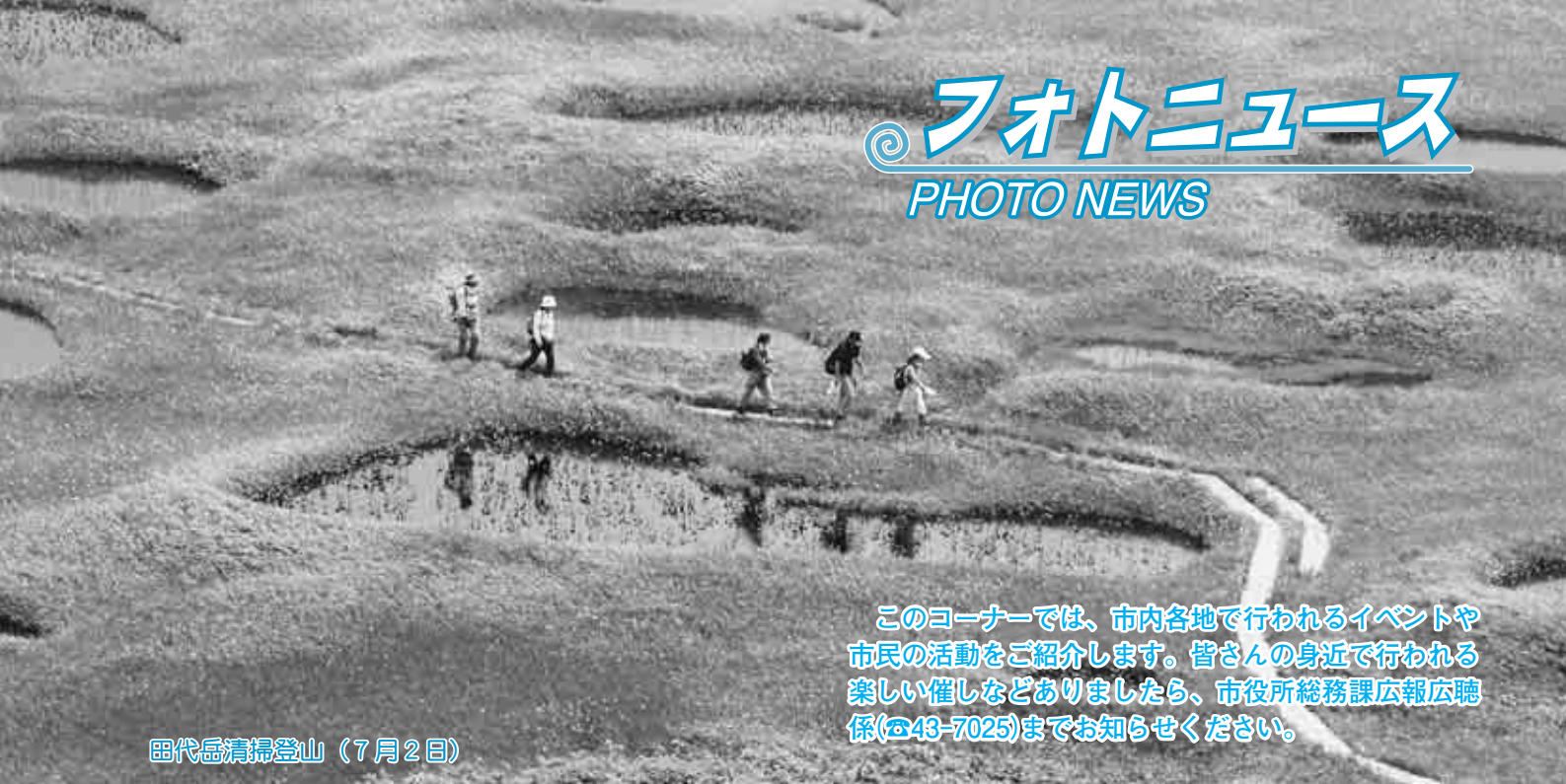
田代岳清掃登山（7月2日）

このコーナーでは、市内各地で行われるイベントや市民の活動をご紹介します。皆さんの身近で行われる楽しい催しなどありましたら、市役所総務課広報広聴係(☎43-7025)までお知らせください。