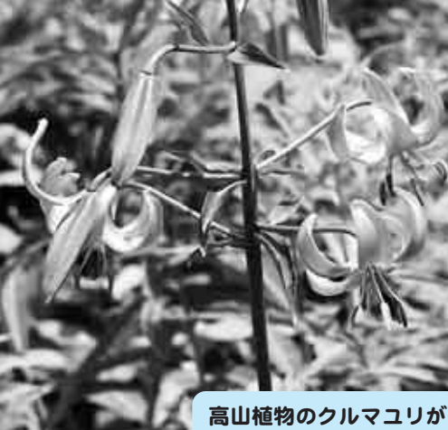
高山植物のクルマユリが見ごろを迎えていました