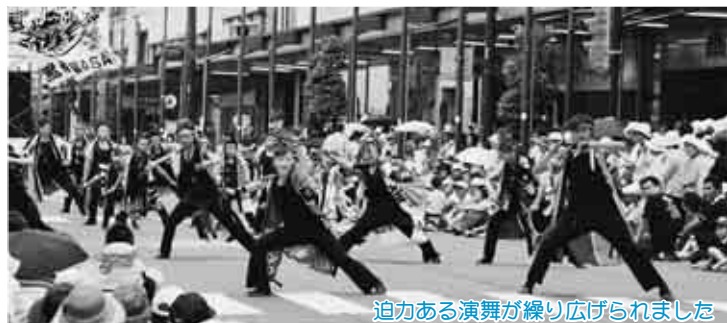
迫力ある演舞が練り広げられました