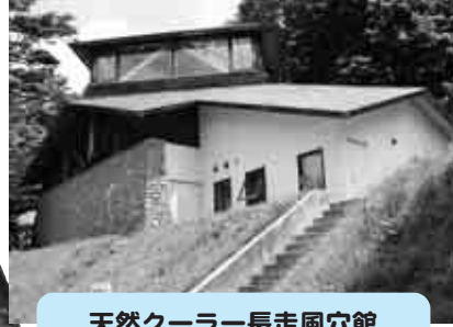
天然クーラー長走風穴館

7月に入り気温がグングン上昇。30度を超える真夏日が続ぎ、フーツ暑い！ そんな日は、涼しいところで取材がしたいなあ…と、今回は天然のクーラー「長走風穴館」に行つてきました。市街地から国道7号を青森方向に車で走ること20分、長走町内を通り過ぎると