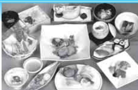
こちらのお写真は10,500円(税込)のお料理でございます。