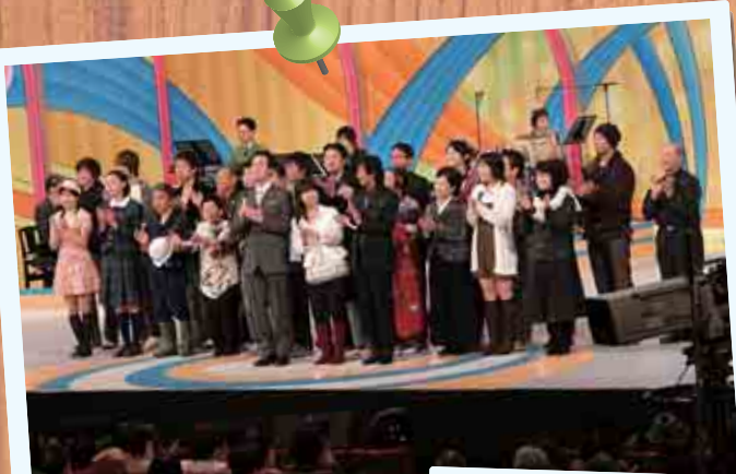
合併1周年記念事業「NHK のど自慢」の公開生放送 (平成18年12月10日)