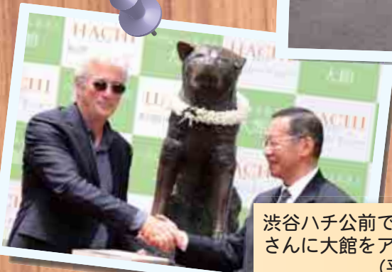
渋谷ハチ公前でリチャード・ギア さんに大館をアピール (平成21年7月7日)