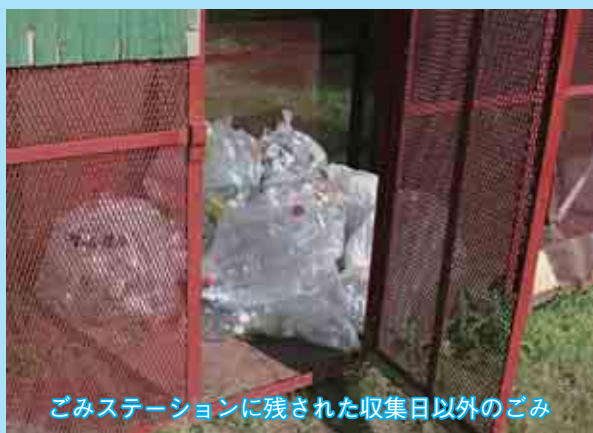
ごみステーションに残された収集日以外のごみ