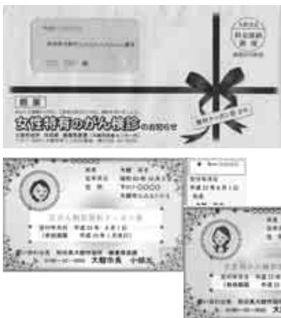
▲クーポン券の見本▲