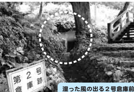
湿った風の出る2号倉庫前 は霧が立ち込めていました

「あってグッド」は、 歩いて行くの方言「あ ってえぐ」と会って良か った(グッド)を掛け合 せ、もじったものです。