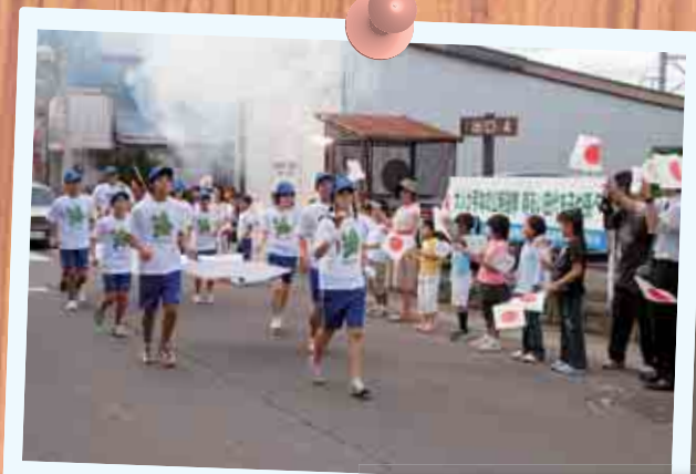
秋田わか杉国体が開催され、市民が炬火リレーに参加 (平成19年10月3日)