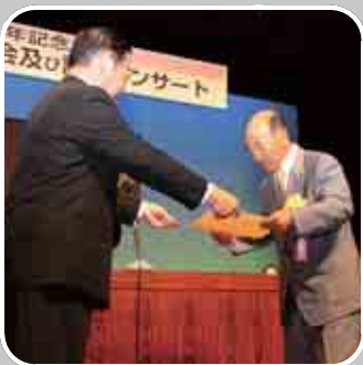
行政協力員の永年勤続者表彰も行われました

また、今後さらに行財政改革を推進する一方で、環境産業や健康産業に代表される大館特有のプラスの要素を伸ばし、官民一丸となつて、前進していかなければならないと考えていますので、市勢発展のためにも、なお一層のご協力をお願い申し上げます。