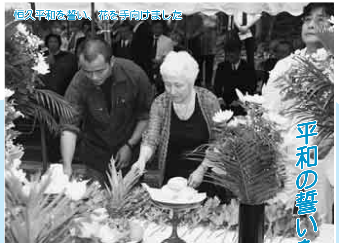
恒久平和を誓い、花を手向けました

社会を明るくする運動・青少年を非行から守る市民のつどいが、桂城公園で開催されました。このつどいは毎年開催されていて、今年も市内の20数団体が参加式典終了後、参加者は桂城小学校と有浦小学校スクールバンド部を先頭に市内をパレードし、安全・安心で明るい街づくりを呼び掛けました。