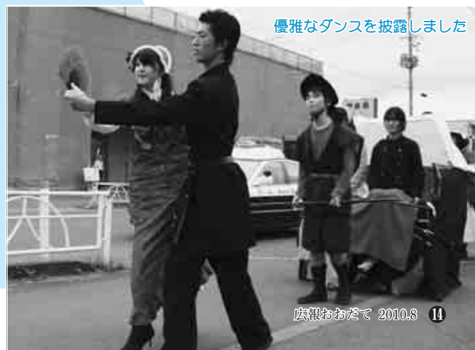
優雅なダンスを披露しました

仮装は、人気アニメの主人公や歌舞伎役者に扮するなど工夫を凝らし、中でも「鹿鳴館」の仮装をしたクラスは、衣装や小道具、踊りにまで手の込んだ内容で、沿道の観客から盛んに拍手を浴びていました。