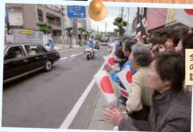
全国植樹祭出席と県内事情視察のため天皇、皇后両陛下が市を訪問 (平成20年6月14日)