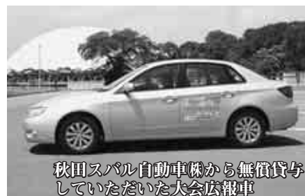
秋田スバル自動車(株)から無償貸与していただいた大会広報車

実行委員会では、大会参加者を温かく迎え、全国へ大館を発信するため企業や団体からの協賛などを募集しています。 物品には、協賛表示することが出来ます。