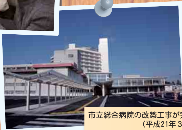
市立総合病院の改築工事が完了 (平成21年3月)