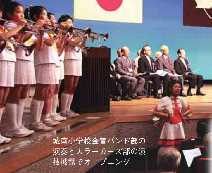
城南小学校金管バンド部の演奏とカラーガーズ部の演技披露でオープニング