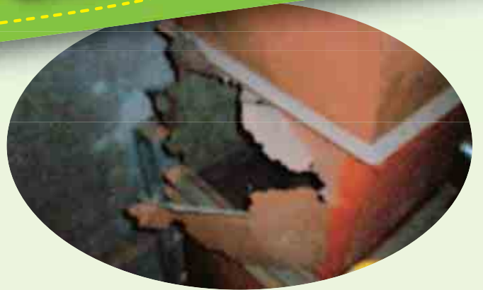
爆発で穴が 空いたダクト