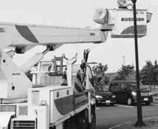
高所作業車を持ち込み街灯清掃 (奥羽電気設備)

高館公園の敷地内で、4月に(有)成典電気、7月に奥羽電気設備(株)の社員による清掃が行われました。 清掃に参加した社員は、滝のような汗を流しながら、街灯を一つ一つ丁寧に清掃しました。