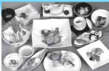
こちらのお写真は10,500円(税込)のお料理でございます。