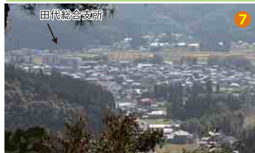
(左) 田代総合支所や早口地区の町なみが一望。(右) 市立総合病院や大町地区周辺の町なみも見えました。