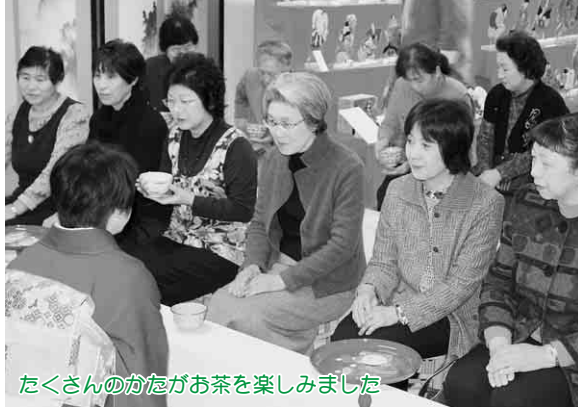
たくさんのかたがお茶を楽しみました

会場には選手の保護者らが集まり、敵陣に攻め込むたびに、大きな声援が上がっていました。