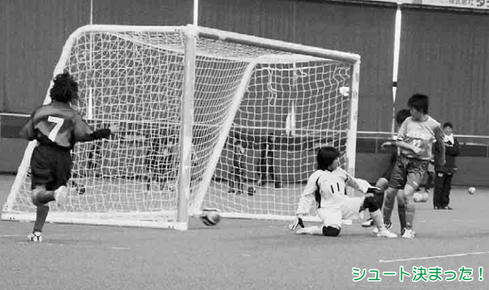
シュート決まった!