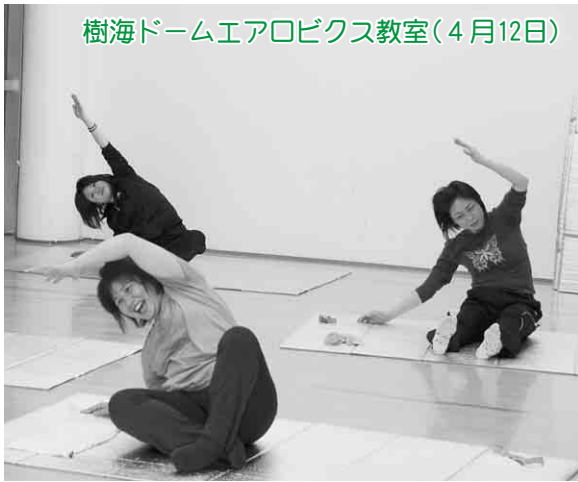
樹海ドームエアロビクス教室(4月12日)

検診の際には、事前に「平成23年度保健ガイド」10ページをご覧ください。受診時の注意事項や検診が無料になるかた、検診予定日をご確認ください。(紛失したかたは、健康推進課か総務課で差し上げます)