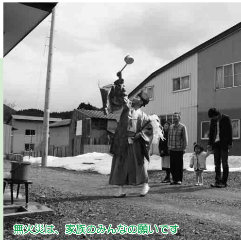
無火災は、家族のみんなの願いです

この日は、総合型スポーツクラブBTOの選手と保護者指導者が、練習会場となる長木川河川緑地広場で、ごみや空き缶などを分別しながら清掃を行い、来るシーズンに向けて準備を行っていました。