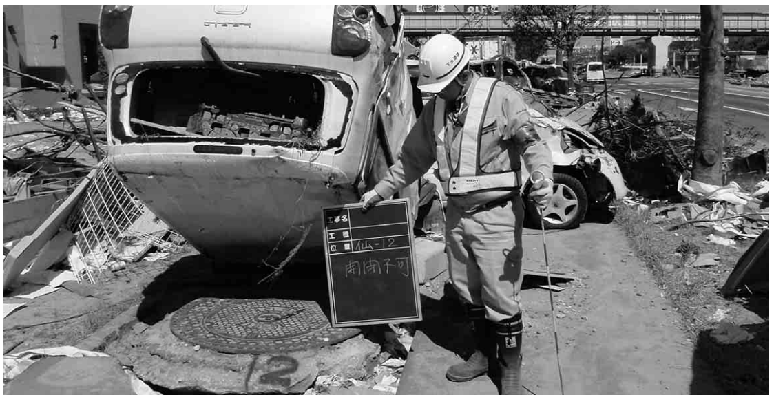
下水道の管路を調査する職員 (4月6日、宮城県多賀城市)

みを要求する手口も発生しています。不審な電話や訪問があったときは、すぐに警察に連絡してください。 大館警察署 ☎42-4111