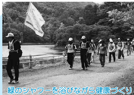
緑のシャワーを浴びながら健康づくり

また、各町内の子どもみこしも練り出し「ワッショイ、ワッショイ」の元気な掛け声とともに、町内を練り歩きました。