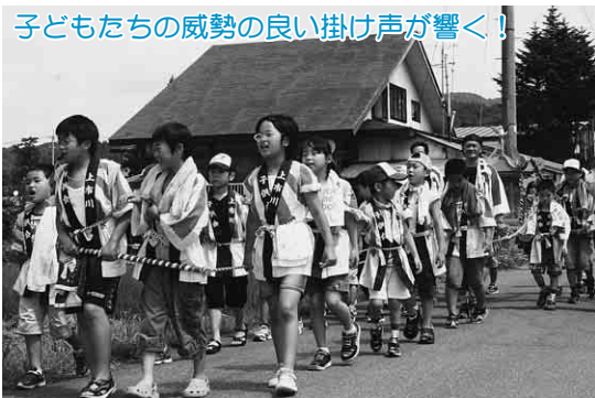
子どもたちの威勢の良い掛け声が響く!

このコーナーでは、市内各地で行われたイベントや市民の活動をご紹介します。皆さんの身近で行われる楽しい催しなどありましたら、総務課広報広聴係(☎43-7025)までお知らせください。