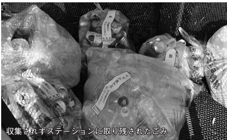
収集されずステーションに取り残されたごみ

「ごみ出しのルールには主に「ごみステーションのルール」、「ごみ袋のルール」、「ごみ分別のルール」の3つがあります。効率的で安全なごみの収集、処理とごみを再生可能な資源として取り組む分別に、市民の皆さんのご理解とご協力をお願いします。