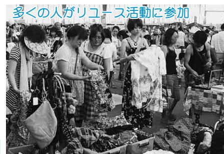
多くの方がリユース活動に参加

ハチ公通りを歩行者天国にした会場では、各団体の迫力ある演舞やあっという間に衣装を替えるパフォーマンスが次々と繰り広げられると、沿道に集まった観客からは大きな拍手が上がっていました。