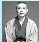
入船亭扇辰

プレイガイド/イオンスーパーセンター大館店、いとく大館ショッピングセンター、はせがわ化粧品大町本店、市民文化会館