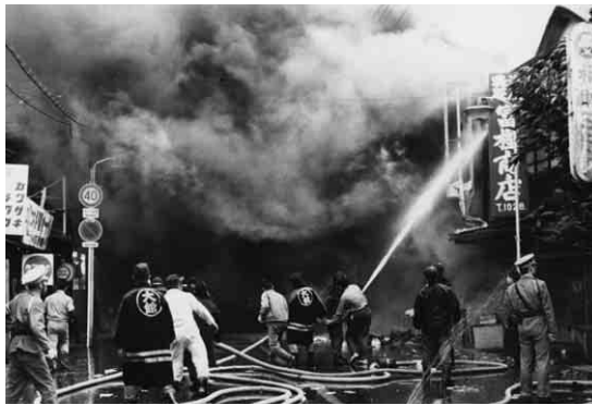
御成町二丁目大火