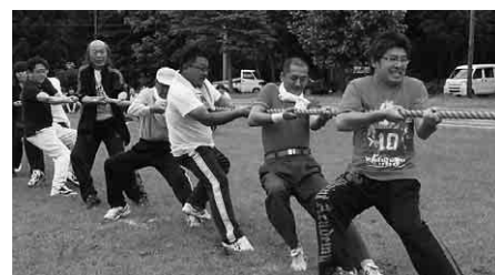
選手も応援も力の入った常会対抗綱引き

「あつてグッド」は、歩いて行くの方言「あつてえぐ」と会って良かった(グッド)を掛け合わせ、もじったものです。