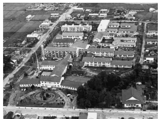
公立大館病院全景