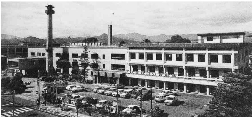
市役所本庁舎増築工事完成