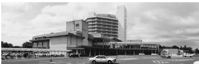
現在の総合病院正面玄関口