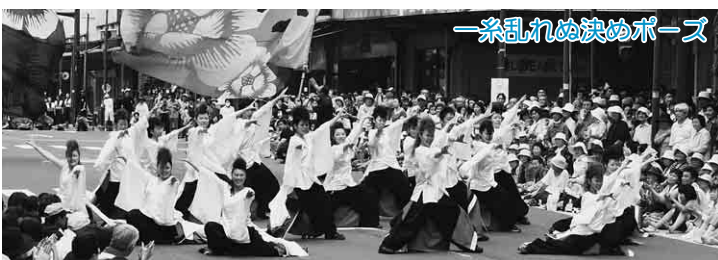
糸乱れめ決めポーズ

ウォーキングデー大館大会 (6月18日) 第11回ウォーキングデー大館大会が岩神ふれあいの森で開催され、8歳の子どもから85歳のお年寄りまで約80人がウォーキングを楽しみました。参加者は初夏の日差しの中、心と体の健康づくりのため、岩神貯水池を周回する約4kmのコースを周りの景色や会話を楽しみながら歩きました。