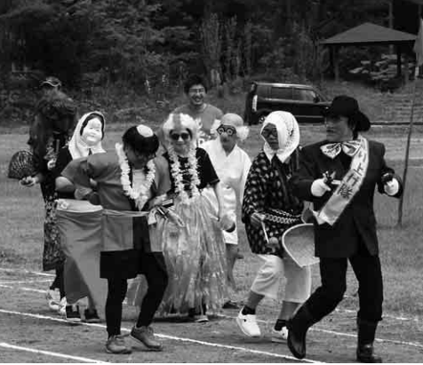
編隊を組み、グラウンドを一周して会場を盛り上げた婦人会の仮装行列!大爆笑!!!