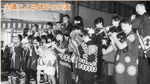
全講による囃子の共演

五穀豊穣、商売繁盛、家内安全を祈念して、大館神明社祭典が行われ、各町内の曳山車16台と子どもみこし11台が市内を巡行しました。 雨に見舞われることが多いため「雨祭り」とも言われる神明社の祭典。初日こそ時折雨が降りましたが、2日目は晴天に恵まれました。 各山車は笛や鐘、太鼓で奏でる大館囃子の軽快なリズムとフイヤカサッサー、ヨーイヨーイの掛け声とともに市内を練り歩きました。 本祭の11日には、大町会場で「山車見世」やフィナーレを飾る「祭典祝い水」が行われ、詰め掛けた見物客からは拍手と歓声が上がっていました。 ※山車は、「通常だし」と読みますが、大館では「やま」と呼んでいます。