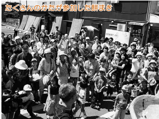
たくさんのかたが参加した餅まき