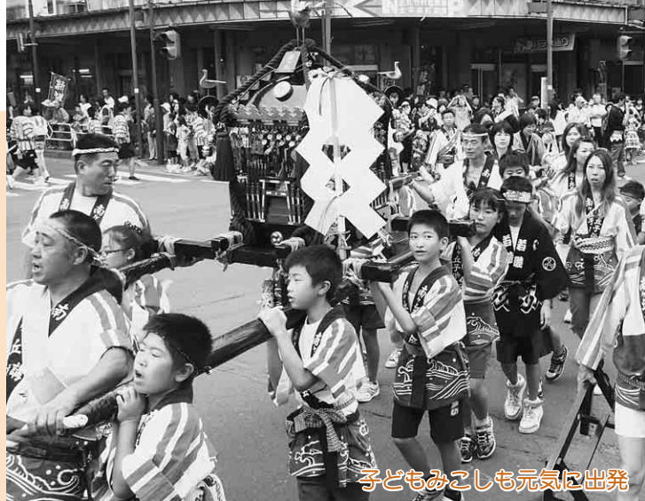
子どもみこしも元気に出発