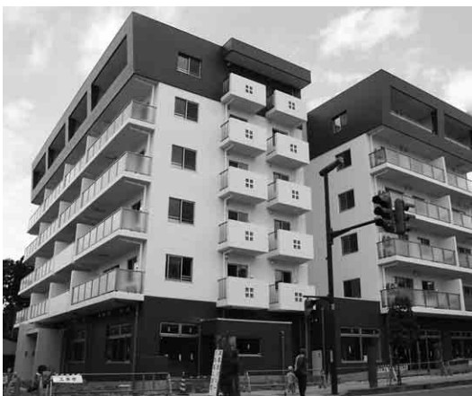
完成したTKマンション大町

本事業の完了に伴い、「街なか居住の推進による中心市街地の活性化」に向け、大きな一歩を踏み出すことができたものと考えています。