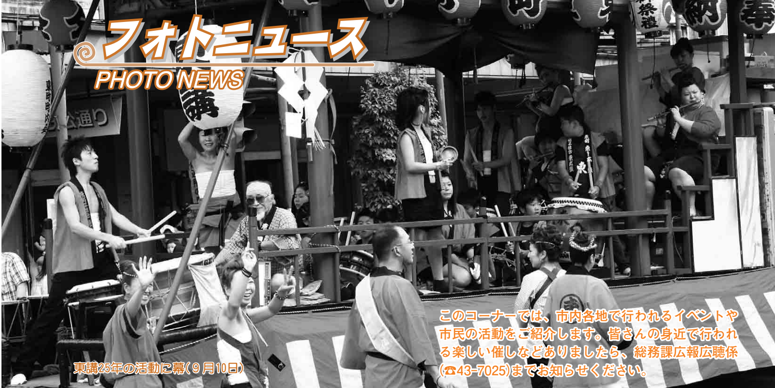
東講25年の活動に幕(9月10日)

このコーナーでは、市内各地で行われるイベントや市民の活動をご紹介します。皆さんの身近で行われる楽しい催しなどありましたら、総務課広報聴係(☎43-7025)までお知らせください。