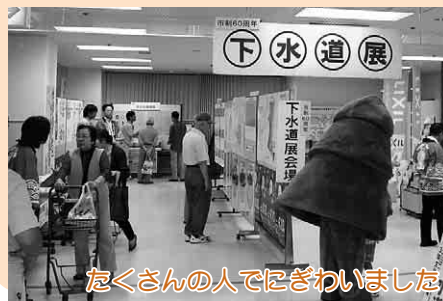
たくさんの方でにぎわいました

いとく大館ショッピングセンターで下水道展が開かれ、500人を超える方々が訪れました。 この下水道展は、下水道の働きや仕組みを広く市民に知ってもらおうと毎年開催しているもので、今年で19回目。 来場者は、分かりやすく解説された下水道の仕組みのパネルなどを見たり、相談コーナーでいろいろな質問をして、普段あまり意識することの無い下水道の知識に触れていました。