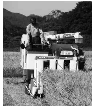
昨年の稲刈りの様子

水稲は、7月中旬から8月末にかけて、カドミウム抑制のために湛水管理が必要な時期であり、一部集落等では