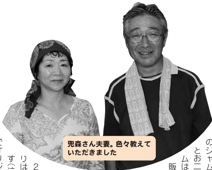
兜森さん夫妻。色々教えていただきました