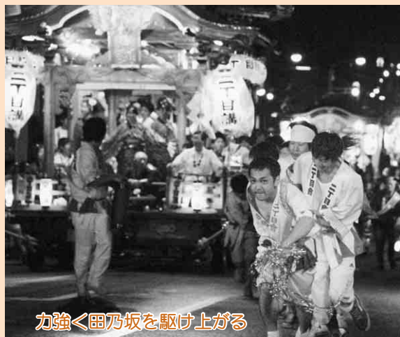
力強く田乃坂を駆け上がる