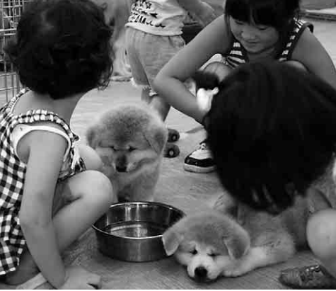
ふわふわもここの子犬は子どもたちに大人気でした