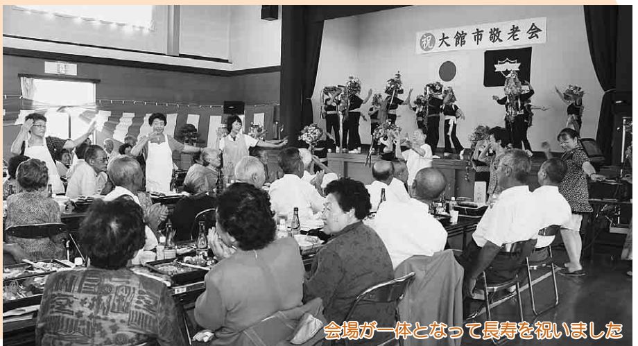
会場が一体となって長寿を祝いました

長木保育所の園児たちのかわいらしい遊戯や有志の楽しい余興が披露されると、参加者からは笑顔がこぼれていました。