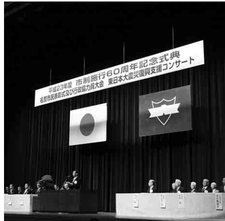
市民文化会館で行われた記念式典

この60周年を契機に、改めて市民の一人ひとりが安心して誇りを持って暮らしていく大館市の実現と、さらなる市勢の発展に向け、全力で取り組んでいきます。