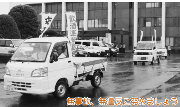
無事故、無違反に努めましょう

出発式と交通安全功労者の表彰を行ったあとに、パレードが出発。パトカーを先頭に軽トラック21台が、「交通安全」や「飲酒運転追放」などののぼり旗をなびかせて、ドライバーや歩行者に注意を呼び掛けました。