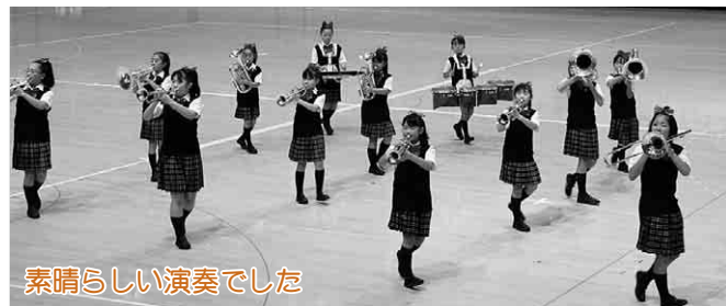
素晴らしい演奏でした

第28回秋田マーチングフェスティバル大館大会が樹海体育館で行われ、出場者は日頃練習を重ねてきた演技や演奏を披露しました。 この大会は東北大会の県予選を兼ねていて、県内の小学生チームから一般チームまで、11団体が出場。全日本小学校バンドフェスティバルには、有浦、長木、西館小学校が、マーチングバンド・パトントワリング東北大会には扇田、成章・南小学校が出場することになりました。