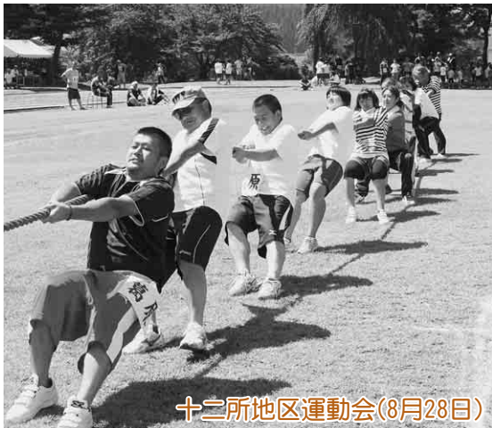
十二所地区運動会(8月28日)

受診の際には、事前に「平成23年度保健ガイド」10ページをご覧ください。受診時の注意事項や検診が無料になる場合、検診予定日などをご確認ください。 (紛失した場合は、健康推進課か総務課で差し上げます)