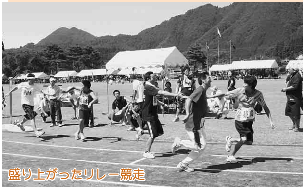
盛り上がったリレー競走