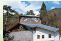
※馆内以风穴的冷气为天然空调 为减轻地球暖化尽一份力