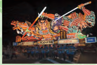
睡魔祭 8月 (青森市) 🚗 1小时 15分