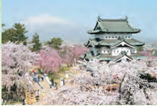
弘前城的樱花 (弘前市) 🚗 40分