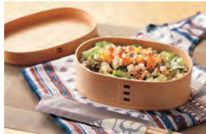
木制便当盒 (传统工艺品)