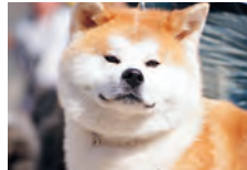
秋田犬 (忠犬八公的故乡)