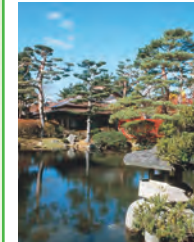
鸟泻会馆 (附茶室日本庭园)