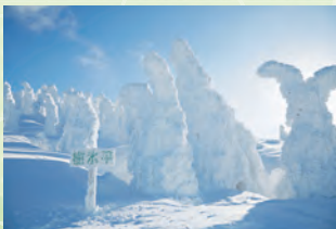
森吉山树冰 (北秋田市) 🚗 1小时 30分