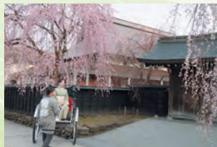
角馆武家宅邸的樱花 (仙北市) 🚗 2小时 30分