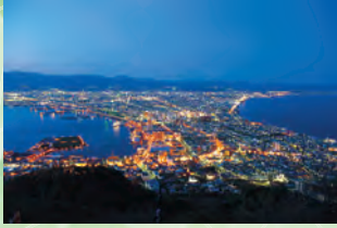
日本三大夜景 (函馆市) 🚗 2小时 50分