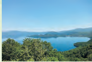
十和田湖 (小坂町) 🚗 1小时